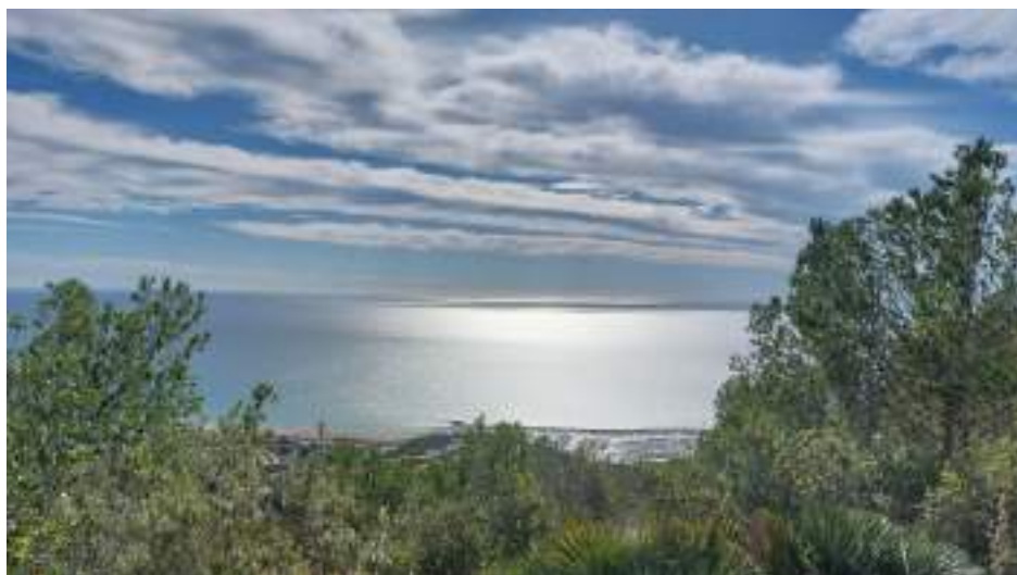
El Mediterráneo desde las costas de Garraf (2-11-2023)

El entierro de la sardina es una ceremonia con la que se anuncia el fin del Carnaval en diversos puntos de España e Hispanoamérica. Los entierros suelen consistir en un desfile carnavalesco que parodia un cortejo fúnebre y culmina con la quema de alguna figura simbólica, generalmente representando a una sardina . El entierro de la sardina carnavalesco se celebra tradicionalmente el miércoles de Ceniza y en él se entierra simbólicamente al pasado, a lo socialmente establecido, para que puedan renacer con mayor fuerza, para que surja una nueva sociedad transformada. 1