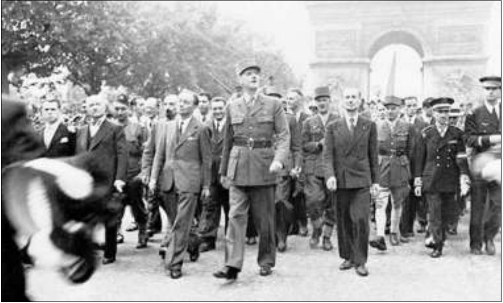
De Gaulle entra en París al finalizar la guerra

independencia nacional (política, económica y cultural). Pasión por la grandeza de la nación, aspiración a la unidad nacional, elogio de la herencia de la Europa cristiana, reivindicación de una Europa de Brest a Vladivostok, resistencia a toda dominación extranjera (americana o soviética), retirada de la OTAN, no alineamiento en la escena internacional, democracia directa (sufragio universal y referéndum popular), anti-parlamentarismo, tercera vía que no fuera ni capitalista ni colectivista, planificación indicativa, «ordoliberalismo», asociación o participación capital-trabajo, inmigración selectiva y preferencia nacional: estos eran los principales ejes del gaullismo.