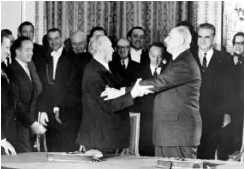
De Gaulle con Adenauer

Firmemente apegado a la tradición colbertista, cree que nada importante puede hacerse en Francia sin que el Estado tome la iniciativa. «El mercado, dice, tiene sus cosas buenas, prima a los mejores, anima a la gente a superarse a sí misma y a los demás. Pero al mismo tiempo crea injusticias, establece monopolios, fomenta las trampas. Así que no se ciegue ante el mercado. No crea que resolverá todos los problemas por sí solo. El mercado no está por encima de la nación y el Estado. Son la nación y el Estado los que deben estar por encima del mercado. Si el mercado reinara, serían los estadounidenses los que reinarían; serían las multinacionales, que no son más multinacionales que la OTAN. Todo es una tapadera de la hegemonía estadounidense». El Estado tiene los medios, tiene que utilizarlos. «El objetivo no es secar las fuentes de capital extranjero», prosigue, «sino impedir que la industria francesa caiga en manos extranjeras. Hay que impedir que la dirección extranjera se apodere de nuestras industrias. No podemos confiar en la abnegación o el patriotismo de los directores generales y sus familias, ¿verdad? Es demasiado fácil para el capital extranjero comprarlos, pagar a sus hijos y yernos en buenos dólares...». «Me importa un bledo BP.