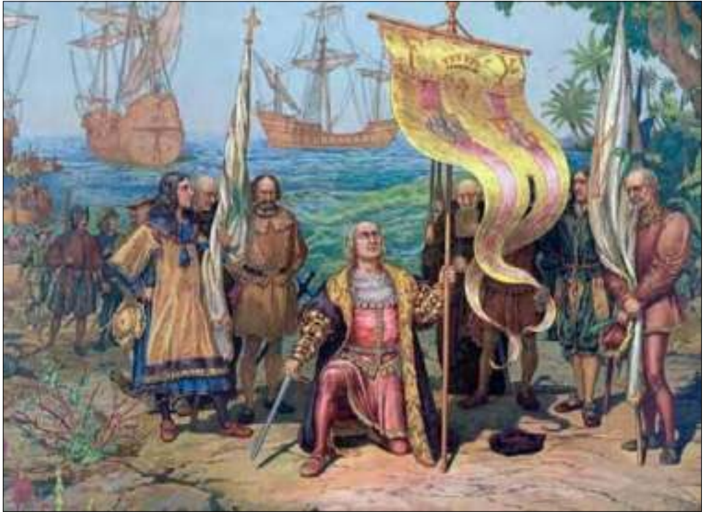
Colón desembarca en La Española

En fin, rápidamente llegué a la conclusión de que, en la inmensa mayoría de los casos, los mayores desacuerdos y posturas radicales vienen del desconocimiento.