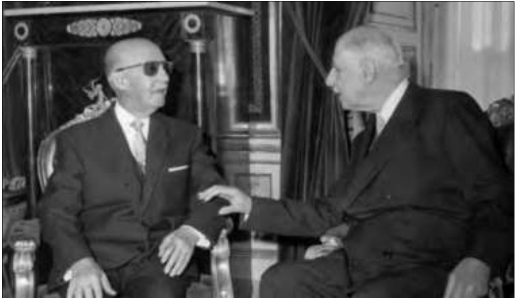
El encuentro de dos Generales

Los vichyistas del norte de África no eran menos hostiles. Los resistentes del interior de Francia tampoco apoyaban unánimemente al general. Durante mucho tiempo, la autoridad del líder de la Francia Libre fue objeto de debate en el seno de los Aliados; los estadounidenses e incluso los británicos buscaron hasta el final un representante francés más dócil y menos intratable. Y de Gaulle no se equivocaba: «Hasta el último día de la guerra», dijo, «habremos tenido que luchar también en ese frente». «Pero hay que decir que, en una guerra de alianzas, cada aliado lucha su propia guerra y no la de los demás». Y de nuevo, con realismo: «Los ingleses que murieron liberando Francia dieron su vida por Gran Bretaña y por el Rey. Los americanos que murieron liberando Francia murieron por los Estados Unidos de América y por nadie más. Al