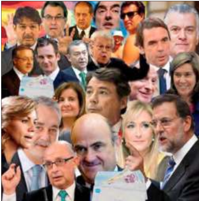
A la cola del Gobierno

Se hizo célebre aquella lacónica frase del torero, cierta o apócrifa, que ante la pregunta maliciosa del motivo del nombramiento de gobernador civil de uno de sus colegas, contestó: Degenerando .