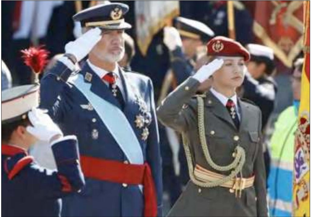
El Rey y la princesa saludan a la bandera

Y por esto y muchas cosas más, me siento agradecida y afortunada, pero también responsable. Siento la responsabilidad de ser española, no solamente cuando me convenga, también cuando sea incómodo y difícil, siendo embajadores de nuestra tierra allá a dónde vayamos. Siento la responsabilidad de cuidar lo que me han dado, ya sea la lengua, la historia, la montaña o la ciudad, siendo consciente de que España es un país al que le queda mucho por avanzar y mucho por crecer, y de cuya historia puedo y quiero formar parte.