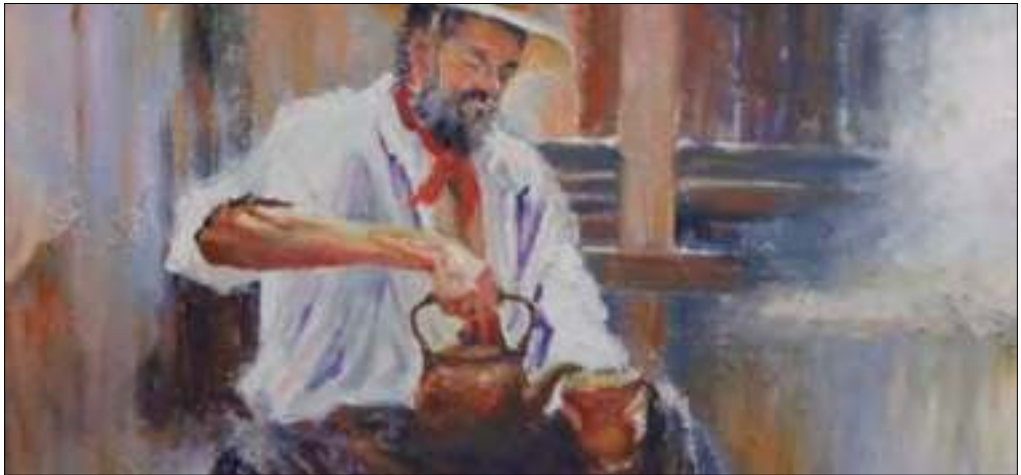
El gaucho como símbolo de la metapolítica

Por verdad del texto se entiende el conocimiento a que nos lleva la hermenéutica. Solo hacemos hermenéutica de un texto o contexto cuando intentamos comprender la verdad del mismo.