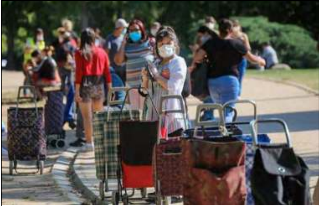
A la cola esperando recibir alimentos

brillan por su ausencia, pero que hasta este momento, solo vemos que el foso se va haciendo cada vez más profundo entre los dos bandos, y la prometida concordia, ofrecida y cacareada por ambos, se transforma en una intransigencia abismal, y un odio, que amenaza con separar otra vez a los españoles de una forma tan peligrosa, que nos recuerdan situaciones que desearíamos no se volvieran a suceder en nuestra patria.