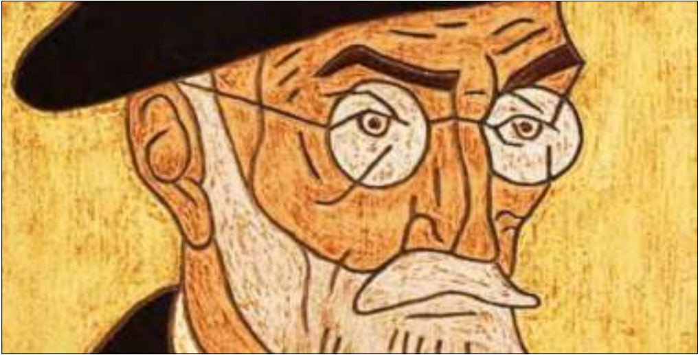
Dibujo de Unamuno

No eran pocos ni insignificantes los que compartían en aquellos días las críticas de Unamuno, entre ellos el ferviente republicano Antonio Machado: