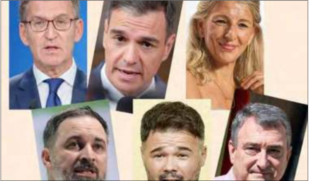
¿Ejemplo de metapolítica?

como le ocurre por ejemplo a un filósofo como Badiou 10 , que mezcla sin hacerse tantos problemas los conceptos de revolución y metapolítica.