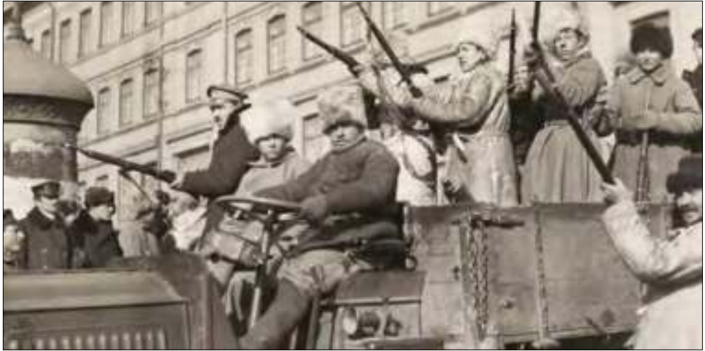
Muestra del terror...

mientras subían los asesinatos, realizados por las izquierdas casi todos, a menudo contra obreros desafectos. La mayoría de los «abusos» atribuidos a las derechas —no todos, desde luego— no pasan de invenciones propagandísticas. Es asombroso cómo una vasta bibliografía de derechas, sugestionada, sin el menor espíritu crítico, por la virulencia de la propaganda izquierdista, ha dado bastante crédito a ésta. No, la insurrección socialista perseguía, desde 1933, instaurar un régimen de tipo soviético. La documentación al respecto es hoy completamente probatoria, y basta leer por extenso las intervenciones de Besteiro para percibir el cariz de todo aquel proceso. Pero además tenemos las instrucciones secretas, la propaganda del PSOE y muchas otras fuentes.