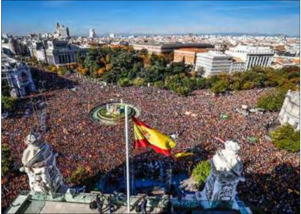
Los españoles se encuentran con la Cibeles

¿Se trata de resistir o de rebatir, de rechazar, de refutar, de afirmar... y de vencer? Escasa moral de victoria puede encerrar un simple resistir en unas trincheras ciudadanas, que, por otra parte, no son apoyadas económica y estratégicamente por la mayor