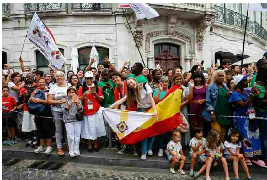
Jóvenes reciben al Papa en Lisboa

Y, ya en un ámbito más doméstico, nuestra propia O.J.E. llevó a cabo, en tierras murcianas, su Campaña Nacional de Actividades,