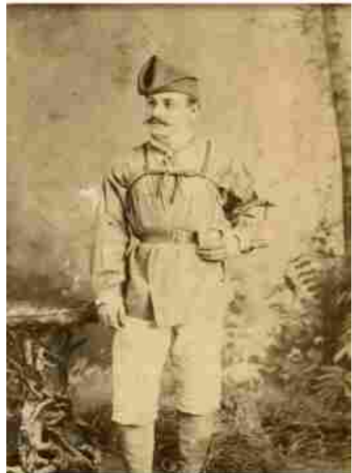
Català amb barretina, a Cuba.

Me alegra saber que cuando se juntan un catalán y un vasco se hablan en castellano para entenderse... 🇪🇸