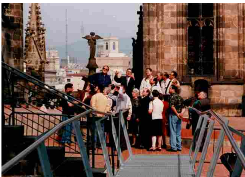
Visitando la Catedral de Barcelona