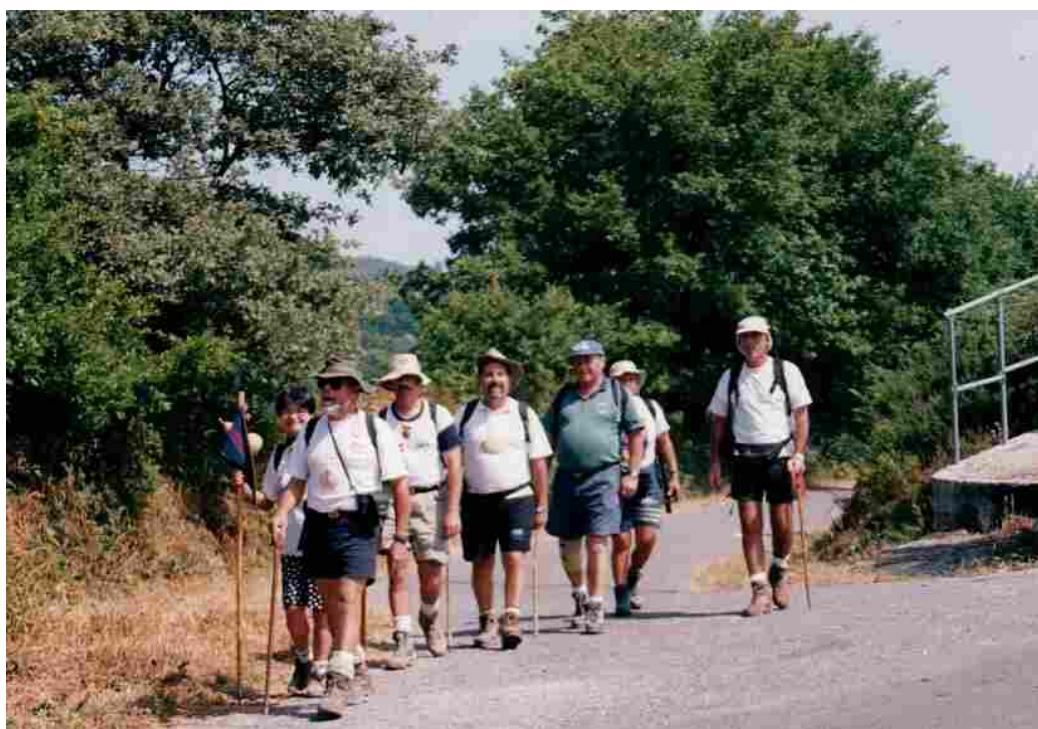
Ruta Jacobea -1999