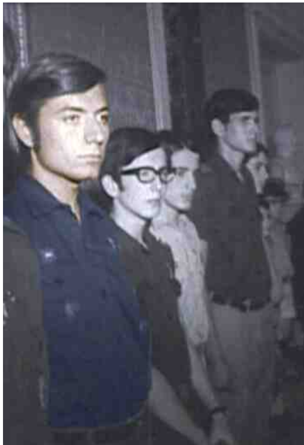
Fotografía tomada durante la visita y ofrenda de Juventudes a Franco, en el palacio de Pedrálbes, en mayo de 1970.

gran inquietud e interés por los aspectos políticos y sociales de su tiempo, también prestaba la mayor atención a sus estudios y a la especialidad que, de verdad, se había convertido en su objetivo profesional. Tanto es así que, en el verano de 1974, cuando la OJE organizó un curso de iniciación a la arqueología, en Ampurias, ya nos lo encontramos allí como profesor. Al año siguiente vuelve a aparecer nuestro camarada al frente del IX Curso de arqueología organizado por la Organización Juvenil Española que se celebró, también en Ampurias, con la participación de 30 jóvenes.