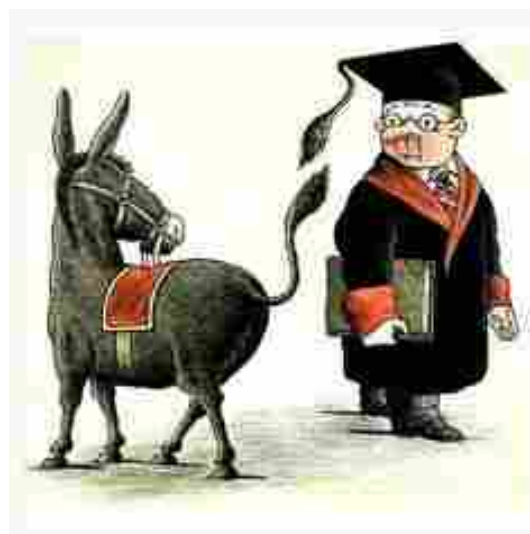
"La linterna de Gracia". 10 de marzo de 1875

Las palabras conquistan temporalmente...Pero los hechos...ésos sí nos ganan o nos pierden para siempre."