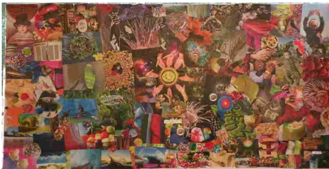
Collage de Manuel Sáinz Pardo