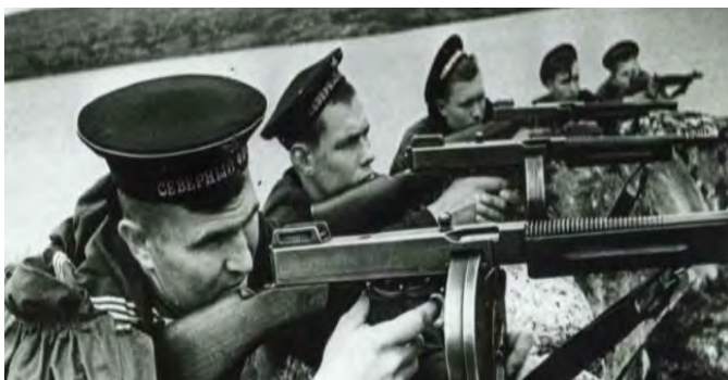
Infantes de marina soviéticos disparando con subfusiles Thompson norteamericanos.

El Tercer Reich ofreció al Reino Unido la paz entre ambos países, de modo que los ingleses pudieran seguir explotando sus colonias en ultramar, mientras que los alemanes se dedicarían a ocupar el este europeo, en especial la Unión Soviética, y así conseguir su "Lebensraum" (espacio vital). Sin embargo, Inglaterra, y Winston Churchill, como su máximo representante, rechazó la oferta, prefiriendo apostar por la alianza anglosajona.