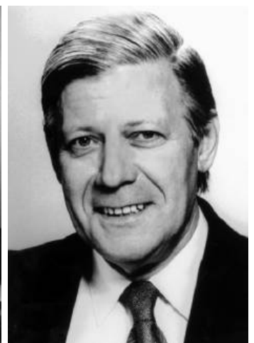
Canciller Helmut Schmidt