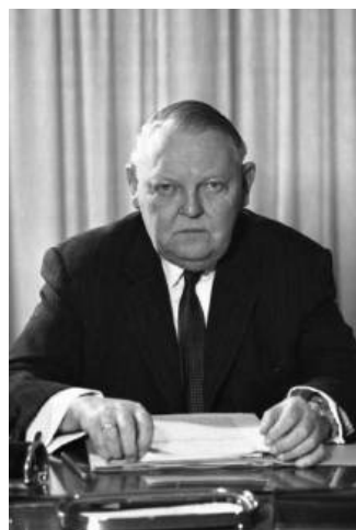
Canciller Ludwig Erhardt

Por lo tanto, el sistema nazi se impuso al final, no ya por la ideología y la continuación de sus representantes, sino en particular porque la mayoría de sus objetivos se cumplieron: Alemania quedó básicamente “libre” de judíos, los comunistas estaban hasta la caída de Muro de Berlín al otro lado y después fueron minoritarios, todos los alemanes conducían un Volkswagen o incluso un coche mejor, las autopistas eran numerosas y la movilidad era absoluta. Alemania se ha convertido en una sociedad consolidada, la lucha de clases ha terminado, las huelgas son excepciones exóticas, los alemanes están presentes en todos los rincones del mundo en términos económicos y turísticos – invadiendo las playas del Mediterráneo, tal y como, por cierto, estaba previsto por el Tercer Reich tras la esperada victoria bélica.