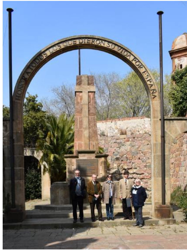
Imágenes de las visitas del sábado día 27.3.21