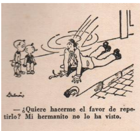
De ÍMPETU, Noviembre 1941